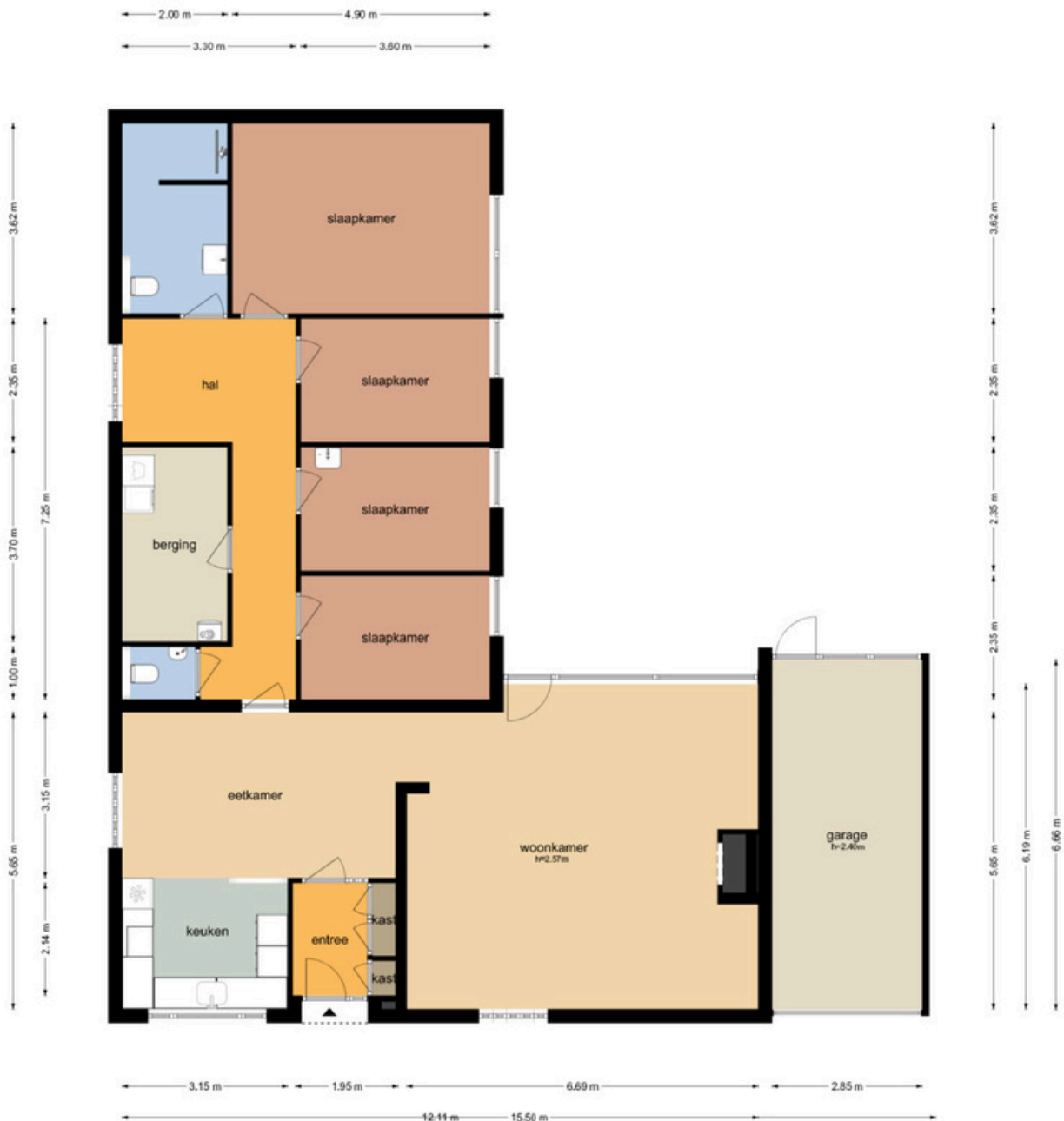
Luytelaer 10 - Eindhoven Begane Grond

De plattegronden zijn geproduceerd voor promotionele doeleinden en ter indicatie. Aan de plattegronden kunnen geen rechten worden ontleend. © www.objectenco.nl